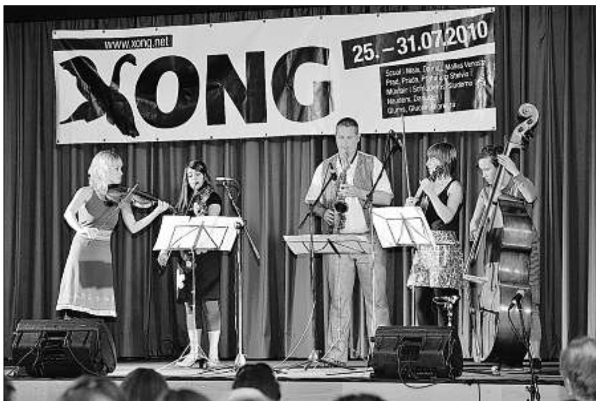
La gruppa Aufstrich ha sunà pel bal final.