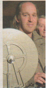
Der ExtraFilmKlub Landeck zeigt wieder im Schloss

(dgh) Der ExtraFilmKlub Landeck lädt auch heuer zu Open-Air-Filmvorführungen im Hof von Schloss Landeck. Beginn ist jeweils um 21.15 Uhr. Das Programm kann sich sehen lassen: Am 6. August wird „Saint Jacques – Pilgern auf Französisch“ gezeigt, eine liebenswerte Komödie. Am 7. August heißt es „Once“: Ein irischer Straßenmusiker und eine tschechische Pianistin beschließen, ihre Träume Wirklichkeit werden zu lassen. Am 13. August gibt's „Kleine Verbrechen“ – der Schauplatz, eine kleine griechische Insel, und die Beschreibung als „Komödie“ lassen auf gute Unterhaltung hoffen. Am 14. August wird „Der Knochenmann“ gezeigt: Brenner ermittelt. Abschließend, am 15. August, kredenzt der Extra-