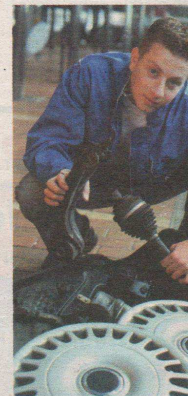
Nicht nur jeder Handgriffkulation und das Maß „passen“ um als Unternehmer erfolgreich zu sein. 23.8.2010 im WIFI Imst.

Erfahrene Trainer, speziell gestaltete Unterlagen und eine kundentorientierte Kursorganisation prägen diese Ausbildung, wobei die Erfahrung zeigt, dass für viele Absolventen dieser Kurs zum Ausgangspunkt für eine erfolgreiche Karriere geworden ist. Für viele Branchen gilt die Unternehmer-Prüfung nach wie vor als Voraussetzung für die berufliche Selbständigkeit. Der Kurs vermittelt neben kaufmännisch-rechtlichen Inhalten jenes Management-Wissen, das die Basis für künftige Führungs-